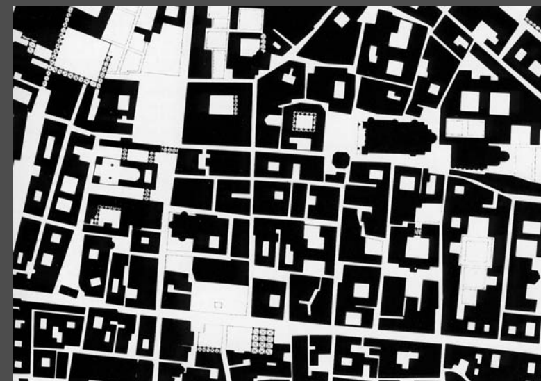
Centro histórico de Parma, plano de figura y fondo

El éxito del espacio público urbano depende de su calidad, no de su cantidad.